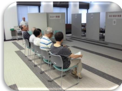
▲血圧脈波検査の順番を待つ皆さん

定員50名のところ300名を超える申し込みがあり、抽選で参加者を決定しました。まだ多くの希望者があることを踏まえ、11月にも開催したいと考えています。